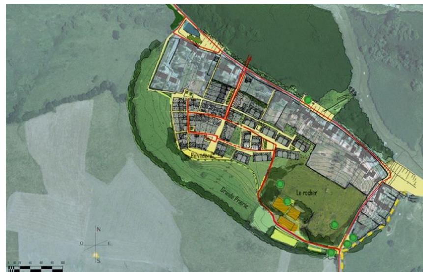
Etude de programmation urbaine - Habiter port Lavigne à Bouguenais ( http://atelierdulieu.com/index.php?option=com_content&view=article&id=48&Itemid=62 )